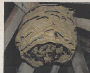
Nid de frelon européen 30 cm, large ouverture vers le bas