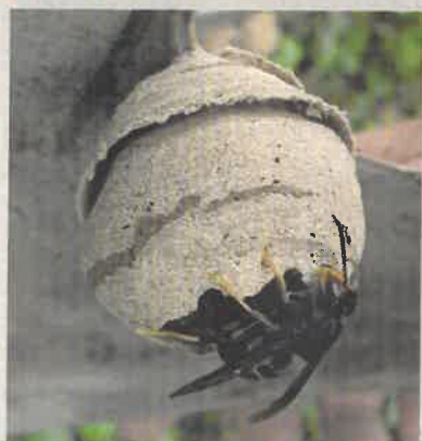
Nid primaire sphériques, 10 cm, endroit abrité

reconnaître un nid de frelon asiatique parmi d'autres nids