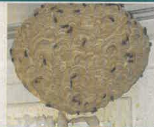
Nid de guêpe 30 cm, petite ouverture vers le bas

Groupement de Défense Sanitaire de l'Eure