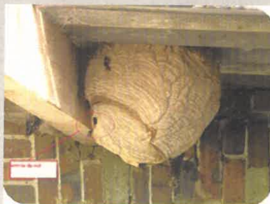
Nid secondaire Sphérique à piriforme Environ 70 cm de diamètre Petite ouverture latérale Arbres, à plus de 10 m (75 % des cas)